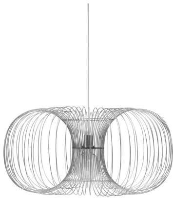
Coil Lamp Ø90 x H: 56,5 cm