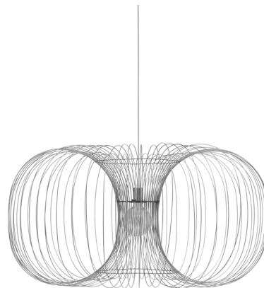
Coil Lamp Ø110 x H: 56,5 cm